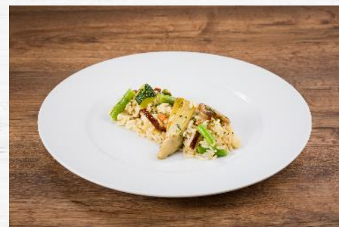
ARROZ CON VERDURAS 2.500 KG