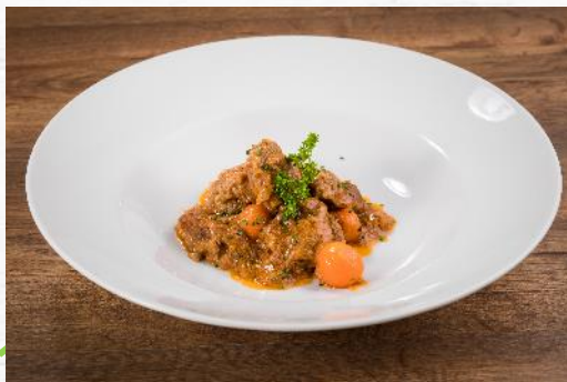
ESTOFADO DE TERNERA 2.500 KG