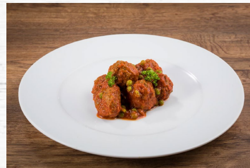
ALBONDIGAS B.M. A LA JARDINERA 3 KG