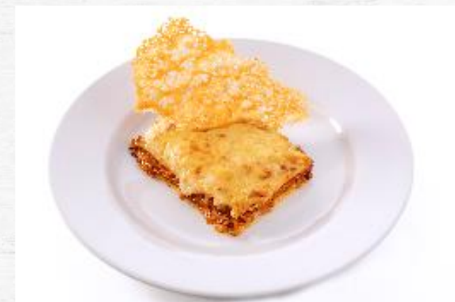
LASAÑA BOLOÑESA 2.600 KG