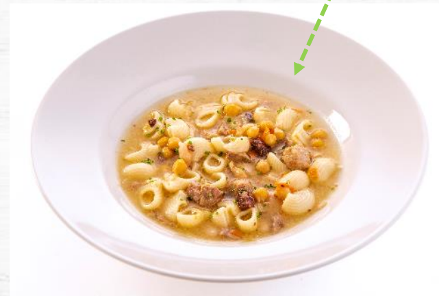
ESCUDELLA 2.800 KG