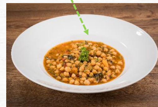
GARBANZOS* GUISADOS CON ESPINACAS Y CALABAZA* 3KG

Carnes melosas y guisos sabrosos. Larga cocción 6-8 horas