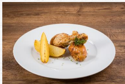
JAMONCITOS DE POLLO ASADO C/4KG