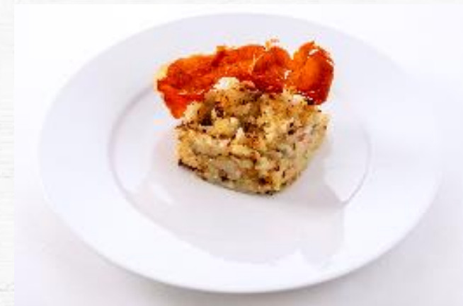
TRINXAT DE LA CERDAÑA 3 KG