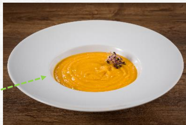
CREMA DE CALABAZA* 3 KG