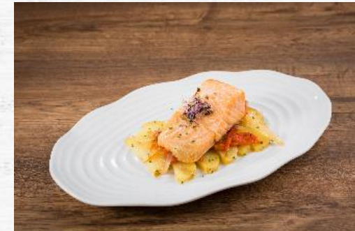
SALMON HORNEADO 6 KG IQF