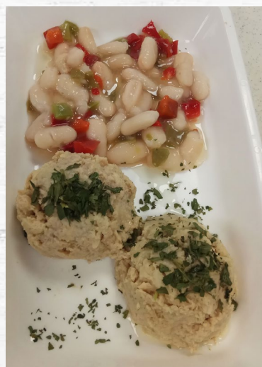
POLLO RUSTIDO Y TRINCHADO 0.800 KG CONG

Ideal para pacientes que se encuentran en el tránsito entre dieta de fácil masticación y triturada, permite hacer el traspaso de una forma progresiva y la mejor adaptación del paciente.