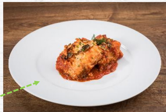
BACALAO COSTA MEDITERRANEA S/S 2 KG