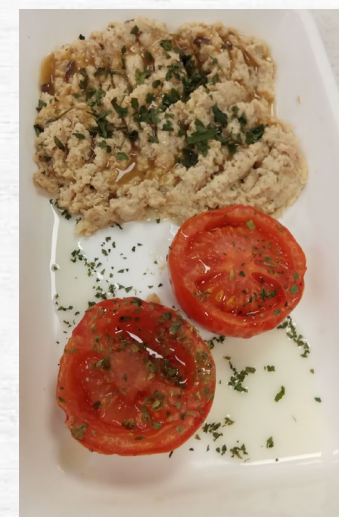
TERNERA RUSTIDA TRINCHADA 0.800 KG CONG