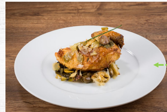
POLLO ESTILO JEREZANA S/S 2.600 KG