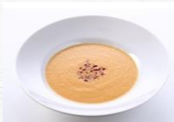
PURE DE ZANAHORIA B/S 3 KG