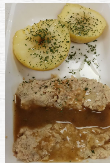
CERDO ASADO Y TRINCHADO B/S 0.800 KG CONG