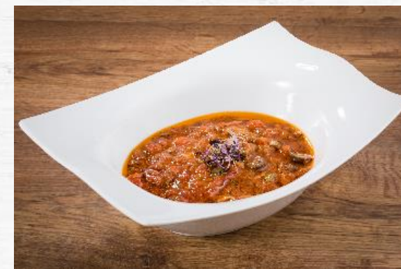
LENTEJAS RIOJANA S/S 3 KG

63% carne de pollo, platos tradiciona- les.